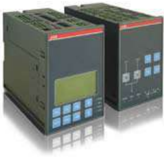
ABB представляет новое поколение электронных блоков АВР - результат мирового опыта применений в низковольтных установках.

Новое поколение серии ATS – ATS021 и ATS022 предлагают самое современное и комплексное решение для непрерывности электроснабжения.